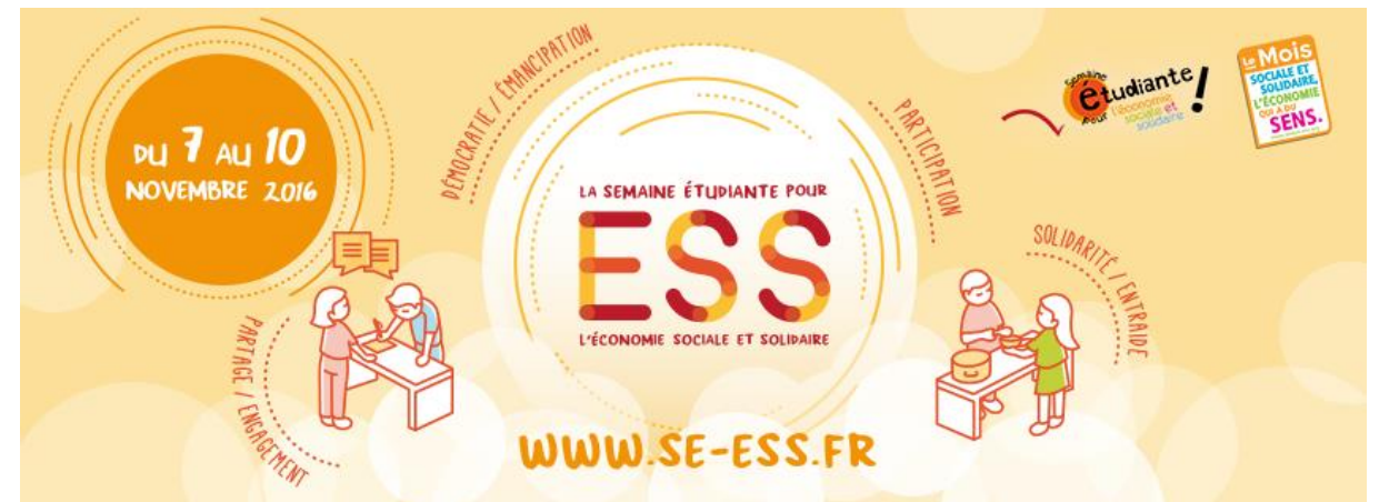
Bannière Facebook SE-ESS 2016